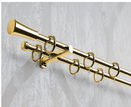
グレイスブライト 16 ゴールド A キャップ 参考価格 2.1m ポールダブル 32,230 円(税込)

高級感・エレガント～フェミニンまで幅広いスタイルのインテリアとして提案できます。