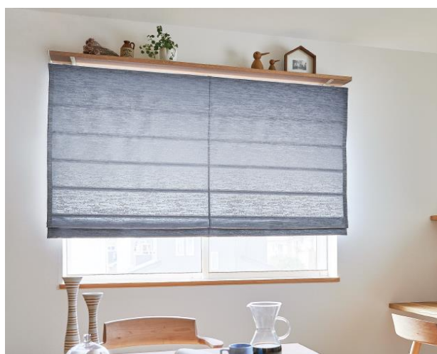
ウインドウシェルフ オーク&ラテホワイト 参考価格 2.00m 27,060 円(税込)