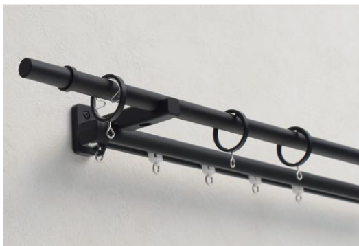
モノ 16 ブラック Aキャップ 参考価格:2.1m ネクスティダブル 23,430 円(税込)

ブラック・ダークグレー・ラテホワイトのモノトーンカラーのラインナップで空間にすっきりとなじみます。